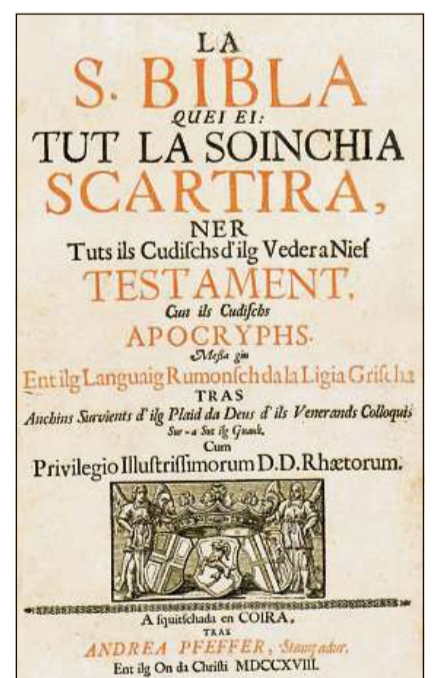
L'uschenumnada Bibla da Cuira (1718).